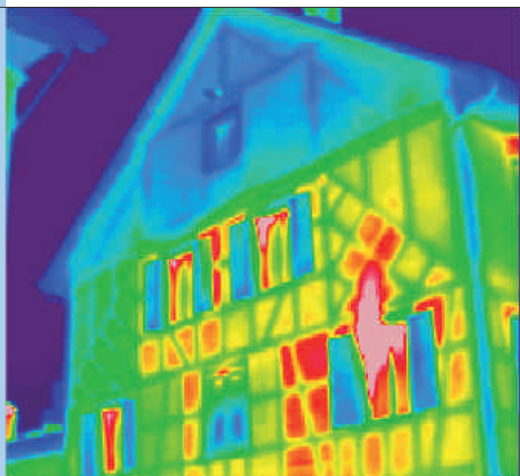
Abb. 6: Thermografieaufnahme eines Gebäudes