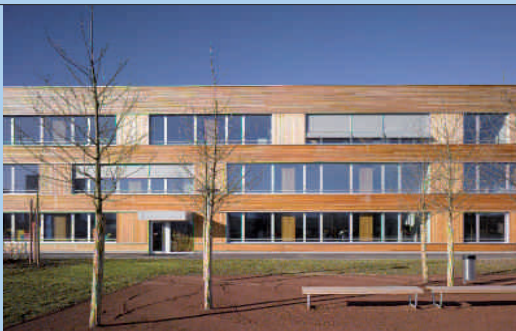
Abb. 1: Lärchenholzfassade Schulhaus Eichmatt