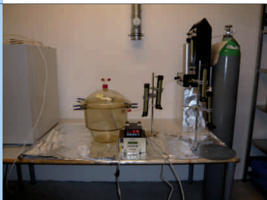
Abb. 3: Messung von Materialemissionen in unserem Labor mit einer Prüfkammer