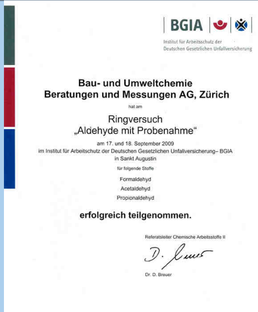
Abb. 5: Erfolgreiche Zertifizierung unserer Messtechnik

Um die Richtigkeit der Resultate von der Probenahme bis zum Endresultat zu bestimmen und unseren Kunden zuverlässige Messresultate liefern zu können, nehmen wir regelmässig an internationalen Laborvergleichen (Ringversuche) teil. Dabei wird die ganze Messapparatur von der Probenahme bis zum fertigen Ergebnis auf Herz und Nieren geprüft. 2009 durften wir die Lorbeeren für unsere Anstrengungen in den vergangenen Jahren im Bereich der Qualitätssicherung nach ISO/IEC 17025 entgegennehmen. Die Zertifikate für erfolgreiche Laborvergleiche im Bereich Formaldehyd und flüchtige organische Verbindungen wurden der Firma BAU- UND UMWELTCHEMIE AG als einziger Messfirma in der Schweiz verliehen.(pt)