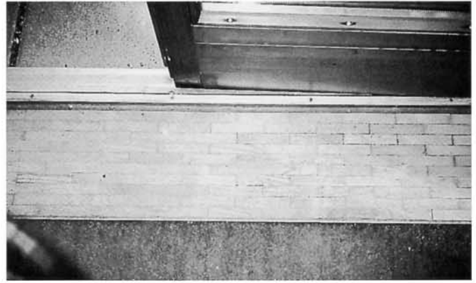
Wässriger Siegel war nicht inert: Bestandteile reagierten mit dem Gummireifen und führten zu durchgehenden Verfärbungen der Lackschicht